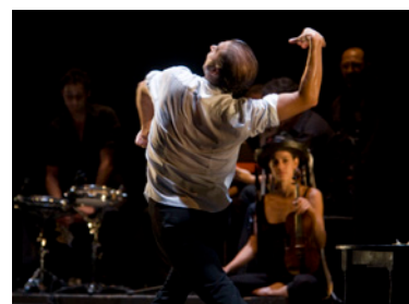
El final de este estado de cosas, redux