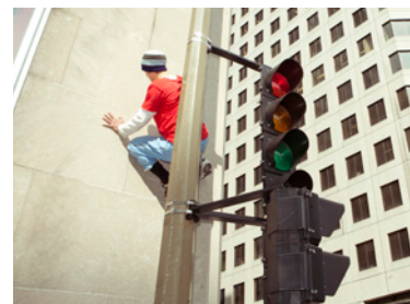
Bodies in Urban Spaces