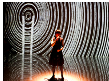
Moi qui me parle à moi-même dans le futur