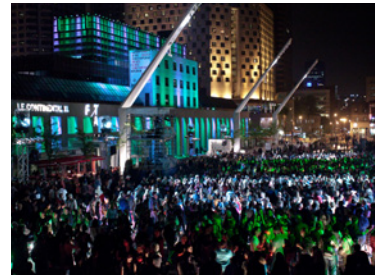
Le continental XL

Contact : Amélie Côté, Festival TransAmériques 514-842-0704, public@fta.qc.ca